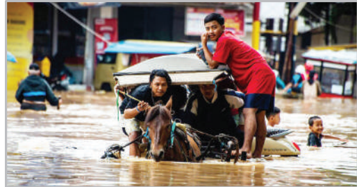
سبل در شهر باندونگ - جاوه اندونزی