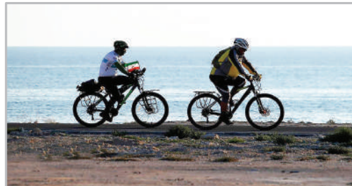
ورود گردشگران دوچرخه‌سوار از سراسر ایران به جزیره کیش