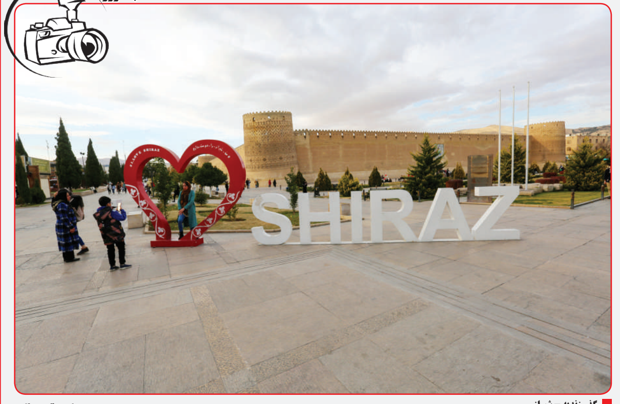
گذر زنده - شیراز