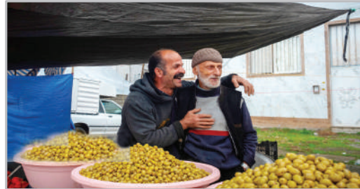
حالت خوب در بازار محلی سیاهکل