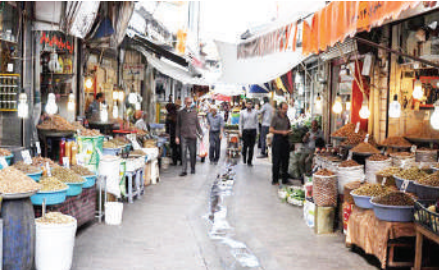
بازار سنتی رشت شامل میدان بزرگ، میدان کوچک، چهارسوق‌ها و کاروانسراها است و از دیدنی‌های رشت به حساب می‌آید.

♦ ساعات کار بازار بزرگ رشت: بازار بزرگ رشت کار خود را از ساعت ۸ صبح آغاز می‌کند و مغازه‌های آن تا ساعت ۸ تا ۱۰ شب فعال هستند. برخی از مغازه‌ها نیز تا ساعت ۱۲ شب کار می‌کنند.