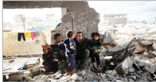
زندگی خانواده‌های فلسطینی در خانه‌های بمباران شده